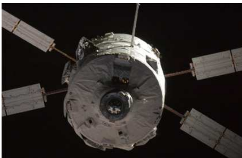
Photo de l'ATV Jules Verne prise depuis l'ISS le 31 mars 2008

9 mars 2008 : Le premier ATV, Automated Transfer Vehicle ou « Vaisseau cargo automatique », est mis en orbite par Ariane. Baptisé Jules Verne, il est destiné à ravitailler la Station Spatiale Internationale (ISS).